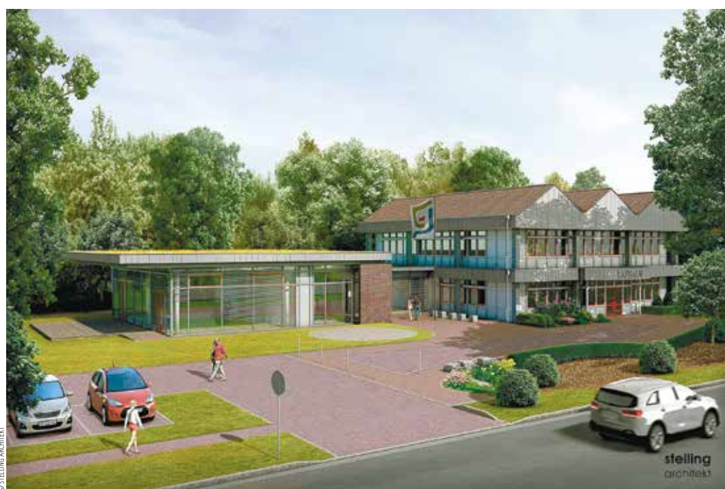
Das geplante „Bürgerhaus Gnarrenburg“ entsteht unmittelbar am Rathaus mit vorgelagertem Dorfplatz